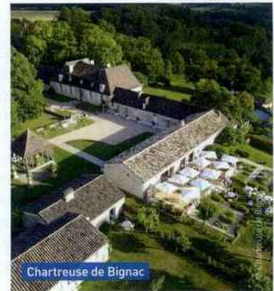
Chartreuse de Bignac