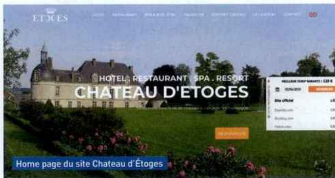
Home page du site Château d'Étoges

Dans la Marne, le Château d'Étoges réalise 60 % de ses ventes en direct et via le réseau Les Collectionneurs (parts non commissionnées). « Nos commissions peuvent atteindre