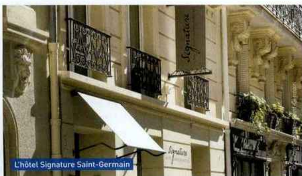
L'hôtel Signature Saint-Germain

direct n'est pas possible partout. « En province, je pense qu'on ne peut pas se passer des distributeurs, à Paris, c'est une hérésie! » Si de nombreux hôteliers préfèrent baisser leurs prix plutôt que ne pas vendre, ne serait-ce que pour amortir leurs charges fixes, Delphine Prigent ne partage pas cette approche. « Cela casse l'image de l'hôtel, celle de notre métier ainsi que celle de Paris. Cela correspond à une approche de court terme car stratégiquement, c'est très mauvais. » (lire également encadré page 42) Côté marketing direct, l'hôtel a la main très légère, seul un e-mail